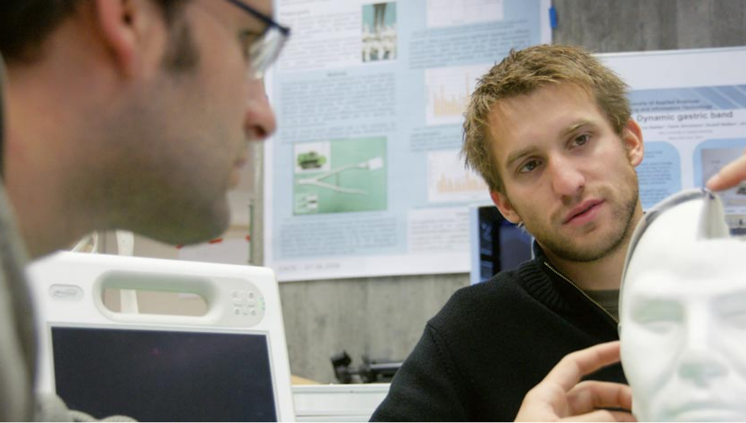
Am Modell wird gezeigt, wie der Katheter mit Flusssensor zur Behandlung von Hydrocephalus eingeführt wird.